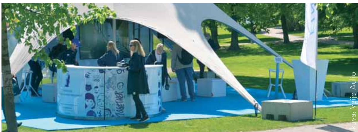
Finavian esittelyalue Kaivopuistossa

Museo oli vuoden aikana mukana Vantaan elinkeino- ja matkailun kehittämisyhmässä, kulttuuri- ja matkailun tapahtumissa ja Matka-messujen kumppanina esittelemässä museota sekä muita Vantaan matkailukohteita.