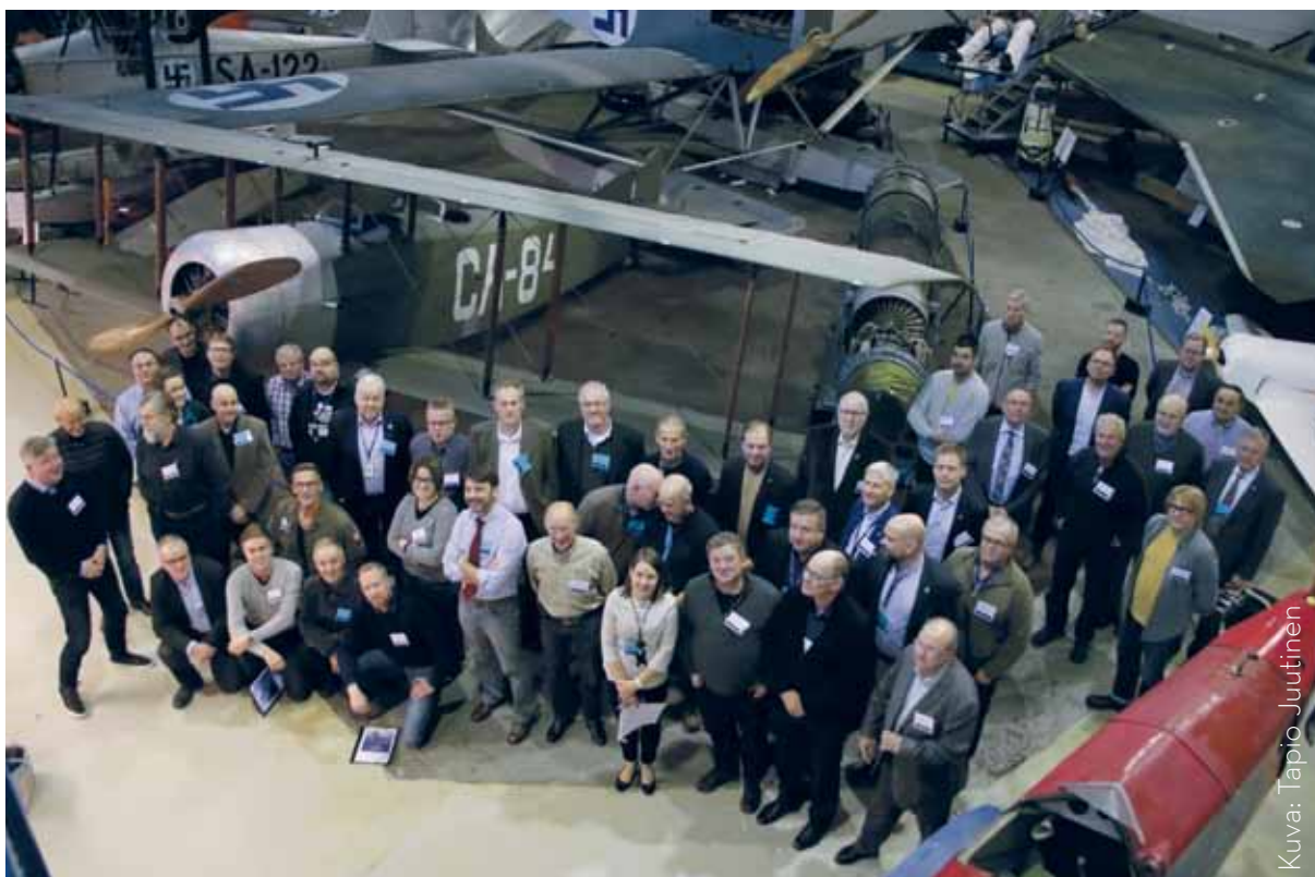
Konferenssin osallistujia Ilmailumuseon näyttelyssä

Kaksipäiväiseen konferenssiin osallistui historiallisten ilma-alusten omistajia, entisöijä ja operoijia Suomesta ja ulkomailta - sekä kotimaisia viranomaisia ja museoalan ammattilaisia. Kaikkiaan konferenssiin osallistui noin 50 henkilöä.